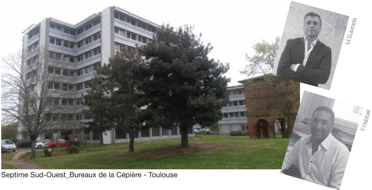
Septime Sud-Ouest_Bureaux de la Cépière - Toulouse